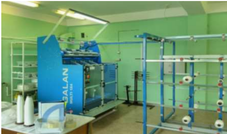
Участок кручения нитей