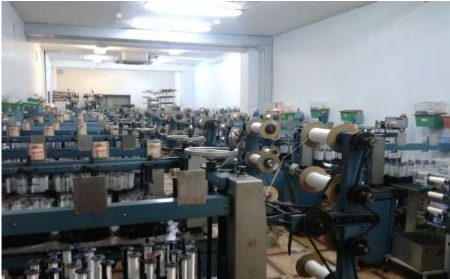
Цех плетения нитей