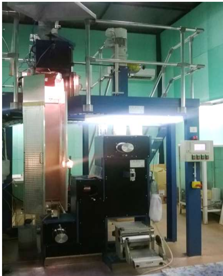
Участок формования рассасывающихся комплексных нитей из расплава полимера