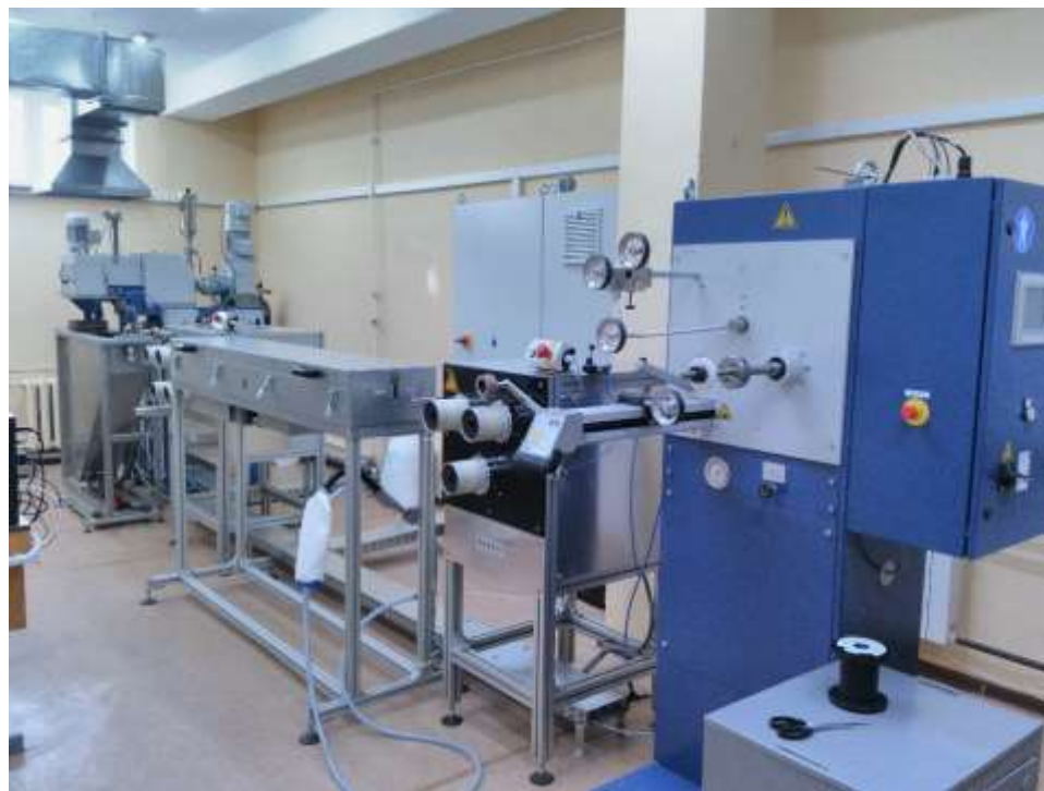
Экструзионная линия рассасывающихся мононитей из расплава полимера пр-во Fourné Maschinenbau GmbH