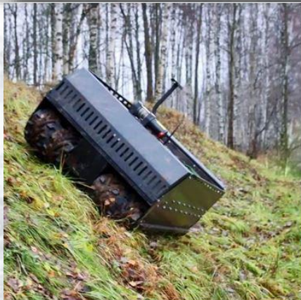
Боковой уклон 45°+