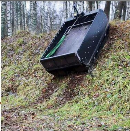
Вертикальный подъем/спуск 70°+